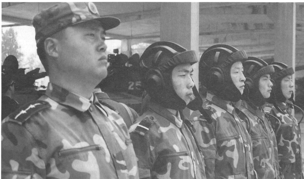
Der Kp Kdt, zusammen mit der Besatzung eines Kampfpanzers am Ende einer kurzen Gefechtsübung..