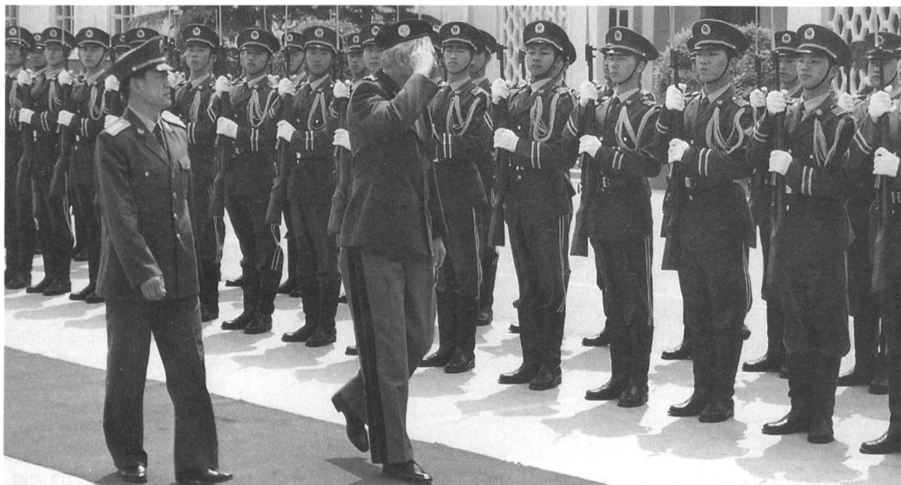
Div Louis Geiger beim Abschreiten der Ehrenkompanie der 6. Pz Div. Diese Div ist für die Sicherheit der Hauptstadt Beijing zuständig.

gäste mit Musik, rotem Teppich und einer Ehrenkompanie empfangen. Man zeigte uns eine Truppenunterkunft, den Simulationsraum für die Panzerausbildung. Zum Schluss gab es eine kleine Übung mit Kampfpanzern und Schützenpanzern im scharfen Schuss. Drill geniesst in der heutigen Ausbildung in China noch immer einen hohen Stellenwert, und der militärische «Rang» einer Person ist von grosser Bedeutung.