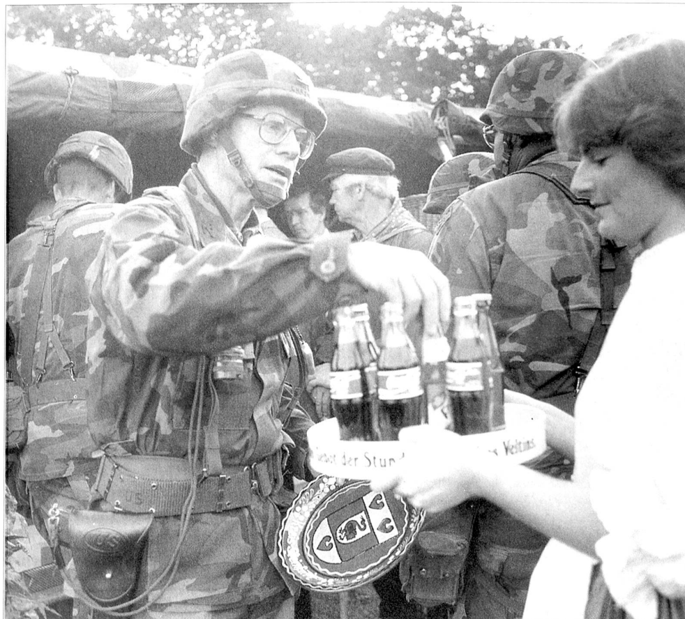
Reforgertruppen werden in Deutschland mit dem US-Nationalgetränk Coca-Cola versorgt.

Seither sind viele Jahre vergangen. Auch bei der US Army hat sich manches geändert, verbessert und verschlechtert. Die C-Rationen sind längst Geschichte und heute herrschen diese schweren, nahrhaften, aber wenig schmackhaften MRE-Mahlzeiten vor. In braunem Plastik sind die getrockneten Mahlzeiten wie Hafengrütze, Fertigmüsli, Stärke und verschiedensten Pflanzlichen verpackt. Der wenig schmackhafte Inhalt hat zwar einen hohen Brennwert von über 3000 Kalorien, wird aber von den Soldaten oftmals verschmäht. Sie werfen die Nahrungsmittel teilweise weg oder verschenken sie bei Manövern an