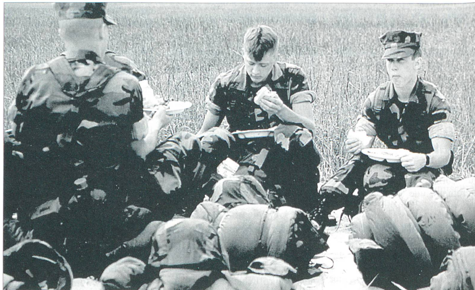
Marines beim Frühstück während einer Übungspause.