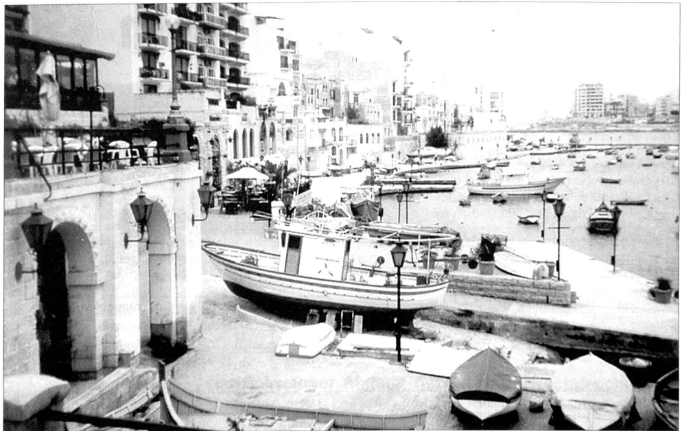
Gelassenheit und Ruhe sind besonders typisch für die Inselwelt Maltas. Sie stand von 1800 bis 1964 unter britischer Herrschaft und ist erst seit 1979 frei von britischen Truppen.

IM DEZEMBER 1942 ... liefen vier Konvois ohne Verluste in den Hafen Maltas ein. Allein in diesem Monat wurden an die 200 000 Tonnen Güter aller Art an Land gebracht. Doch dauerte es lange, bis die durch Mangel an Nahrung und Wohnmöglichkeiten geschwächten Menschen allgemein wieder zu Kräften kamen. Die Auswirkungen der Unterernährung und die damit einhergehenden Krankheiten wurden weiter durch eine schwere Poliomyelitis-Epidemie im November 1942 verschärft, die erst Anfang Juni des folgenden Jahres ihr Ende nahm.