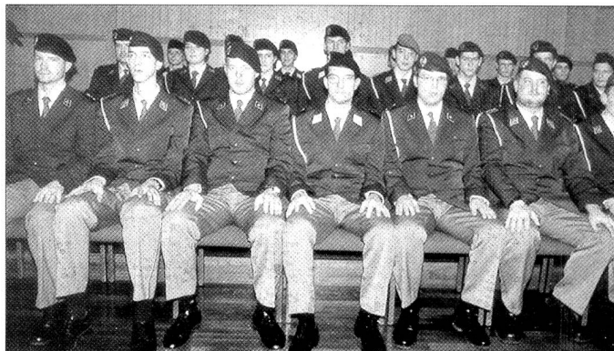
Cette Ecole de Fourriers III/00 qui a débuté à la fin de la 1 ère année du nouveau millénaire et se termine le 1 er mois du nouveau siècle, ne compte que 22 aspirants fourriers, dont 15 Alémaniques, 6 Romands et 1 Tessinois. C'était le première école qui débutait en décembre et se terminait en janvier.