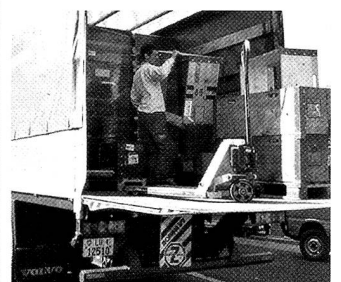
Feierabend ist erst wenn das zurückgenommene Leergut auch wieder im Logistikzentrum abgeladen ist.