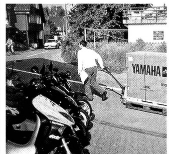
Allein an einem Tag müssen 25 verschiedene Stationen in der Ostschweiz beliefert werden.