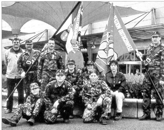
ARMEE-LOGISTIK berichtete bereits ausführlich über die Teilnahme der St. Galler am Berner Zweitagemarsch (7/2001, Seite 22). Zur Ergänzung zum Artikel wollen wir unseren Leserinnen und Lesern das Gruppenbild nicht vorenthalten.