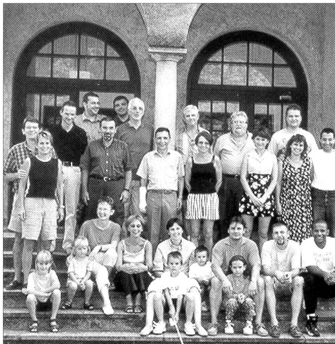
Foto di gruppo all'entrata della Caserma di Losone.