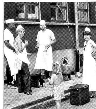
Un gruppo di partecipanti mentre si gode una meritata pausa.

Il programma prevedeva un'istruzione all'ordinario della truppa abbinato ad un concorso di cucina. I partecipanti, dopo una breve data d'ordine, hanno dovuto calcolare ed allestire la lista spesa. Il credito della sussistenza a disposizione fungeva da base per gli acquisti, che dovevano essere fatti – risolvendo dei compiti – presso dei fornitori locali (azienda agricola Terreni alla Maggia d'Ascona, enoteca Ange-