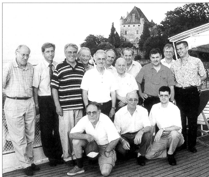
Le groupe sur le pont du bateau «Le Rhône»; à l'arrière plan, le château d'Yvoire.

fgy. En juillet, nous étions 15 membres à nous rendre chez nos voisins vaudois, et plus précisément à la buvette de la plage de Crans-près-Céligny. Les jeux de cartes ne font plus partie du début de soirée, mais par contre, les discussions vont bon train autour de quelques verres de rosé bien frais. Cette année, notre ami