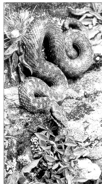
Die Kreuzotter im Val Faller passt sich auch farblich der alpinen Umgebung an. Auf Augendistanz konnte dieses wunderbare Exemplar betrachtet werden – eine Erfahrung, die kein TV-Bild ergeben kann.

Höhepunkt der Exkursion war das Auffinden einer lebenden Kreuzotter, welche durch den Exkursionsleiter eingefangen wurde. Damit er dies tun konnte, hatte er eine kantonale Fangbewilligung einzuholen, welche ihm vorschrieb, das zu Demonstrations-