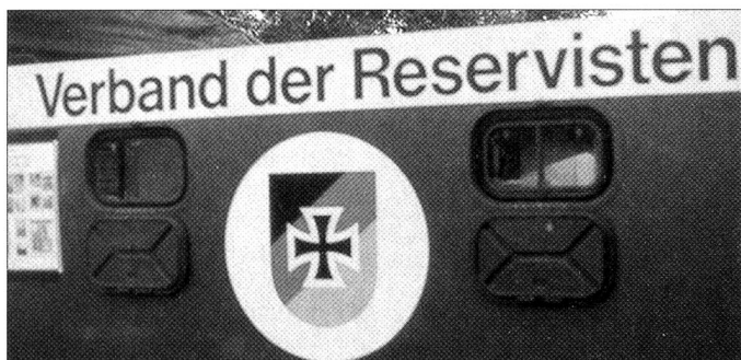
Der Verband der Reservisten nimmt sich der militärischen Förderung an.