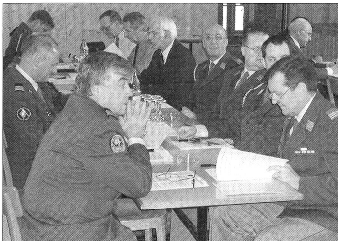
Ein Blick auf den Ehrenmitgliedertisch.