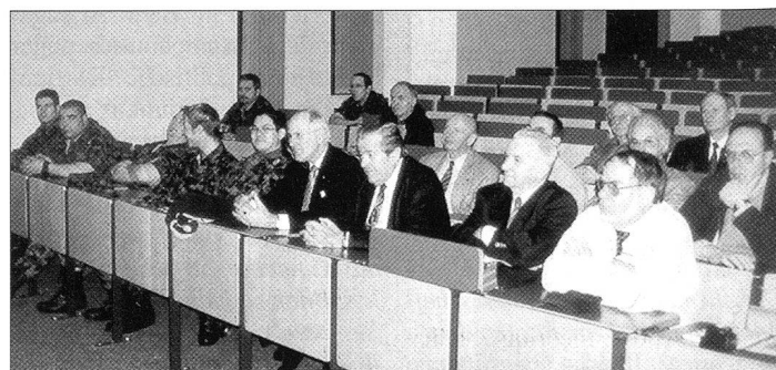
Une partie des participants.