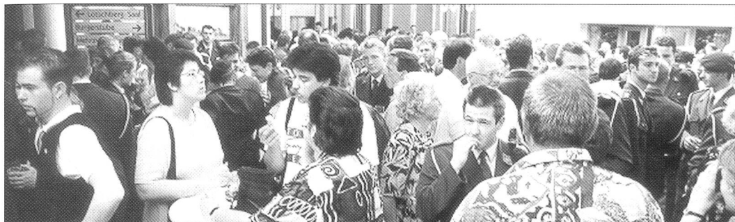
Beim Gemeindezentrum Lötschberg feierte viel Volk die neu brevetierten Fouriere.