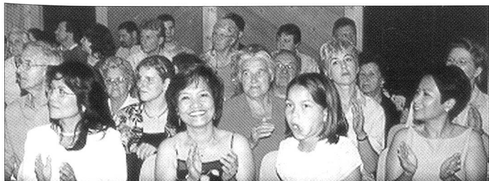
Zahlreich sind sie erschienen, die Angehörigen und Freunde der Fourieraspiranten und zollten ihren «Lieblingen» grossen Applaus.