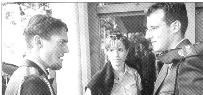
In ein angeregtes Gespräch verwickelt waren nicht nur diese beiden Absolventen der Fourierschule 1/2002 ...