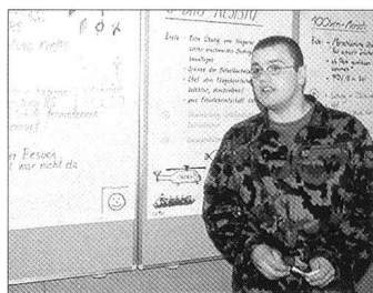
U «AUSB FK TRUPPENKOCH» (13. Woche)