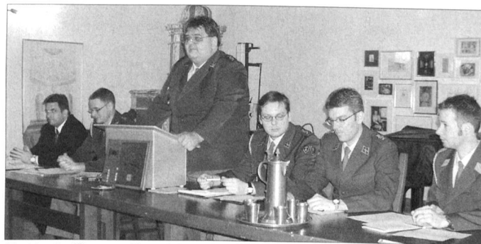
Die Vereinsführung während der reibungslos verlaufenen Generalversammlung.

kirchliche Zentrum im Jahre 1027 durch Ita von Lothringen und Graf Radebot von Habsburg.