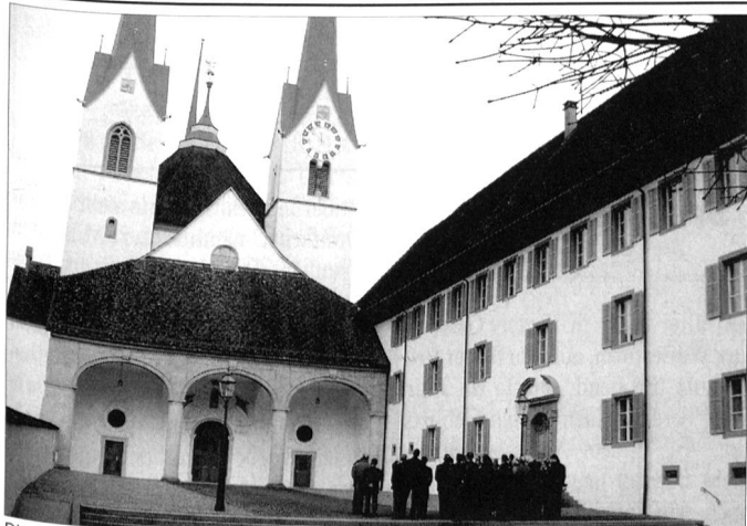
Die imposante Klosterkirche von Muri AG.