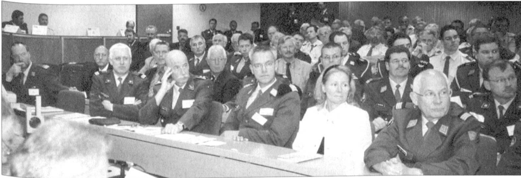
Die Tagung fand im modern eingerichteten Conference Center der SWISS statt.