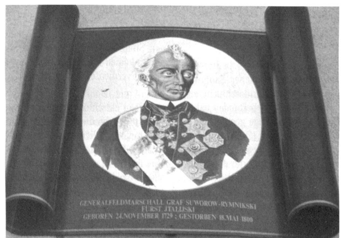
Suworow auf Wirtshausschild beim Restaurant Teufelsbrücke.

Nach dem Untergang der alten Eidgenossenschaft wurde die Schweiz zum Kriegsschauplatz der europäischen Mächte. 1799 schlugen sich mit wechselseitigem Erfolg Franzosen, Österreicher und Russen am Gotthard. In Erinnerung geblieben ist vor allem die denkwürdige Alpenüber-