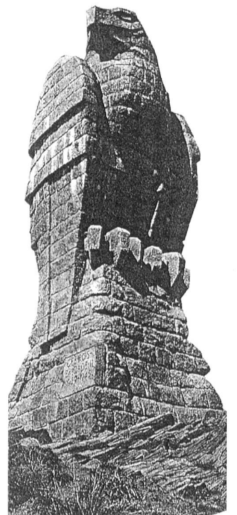
Denkmal der Gebirgsbrigade 11 auf der Simplon-Passhöhe.

Dank der Führung eines Einheimischen gelang es den Franzosen von Guttannen aus, über die Höhen des Nägelsgrätli in einer Umgehungsaktion, am 14. August 1799 auf die Grimsel und in den Rücken der österreichischen Stellung vorzustossen. Die Österreicher wurden bezwungen und zogen sich ins Goms zurück.