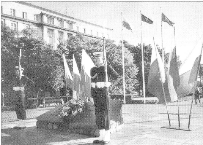
Gdynia/Gdingen: Gedenkstätte für die Gefallenen der polnischen Seestreitkräfte.