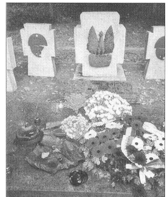
Westerplatte: Grabstätte der Verteidiger.

Sicherheits-, Verteidigungs- und Militärpolitik des veranstaltenden Landes und andererseits über den diesbezüglichen Stand in den Staaten der Teilnehmer orientiert. Mit grosser Überzeugung legten die Vertreter des polnischen Verteidigungsministeriums den seit dem Beitritt zur NATO (1999) anhaltenden Wandel ihrer Streitkräfte dar. Dabei war der unmittelbare Einfluss der USA unübersehbar, der auch in der Beschaffung von 48 amerikanischen F-16 «Fighting Falcon» Kampfflugzeugen zum Ausdruck kommt. Jedenfalls nimmt Polen seine äussere und innere Sicherheit sehr ernst und bereitet sich auf den künftigen Schutz der EU-Aussengrenze bestmöglichst vor.