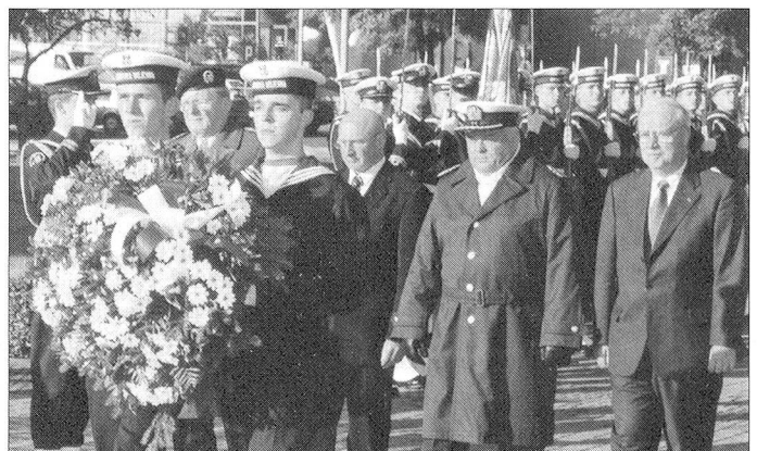
Ehrung der Gefallenen der polnischen Seestreitkräfte.

Sicherheits-, Verteidigungs- und Militärpolitik des veranstaltenden Landes und andererseits über den diesbezüglichen Stand in den Staaten der Teilnehmer orientiert. Mit grosser Überzeugung legten die Vertreter des polnischen Verteidigungsministeriums den seit dem Beitritt zur NATO (1999) anhaltenden Wandel ihrer Streitkräfte dar. Dabei war der unmittelbare Einfluss der USA unübersehbar, der auch in der Beschaffung von 48 amerikanischen F-16 «Fighting Falcon» Kampfflugzeugen zum Ausdruck kommt. Jedenfalls nimmt Polen seine äussere und innere Sicherheit sehr ernst und bereitet sich auf den künftigen Schutz der EU-Aussengrenze bestmöglichst vor.