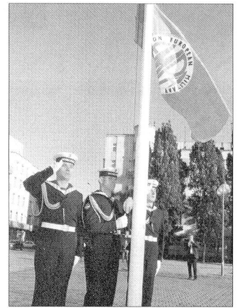
Hissen der EMPA-Flagge.

Hauptzweck der EMPA ist der gegenseitige Austausch von Informationen und Dokumentation zugunsten der Militärfachpresse sowie die Förderung der Berufsethik und des Wissensstandes der Mitglieder. An den Kongressen wird einerseits über die