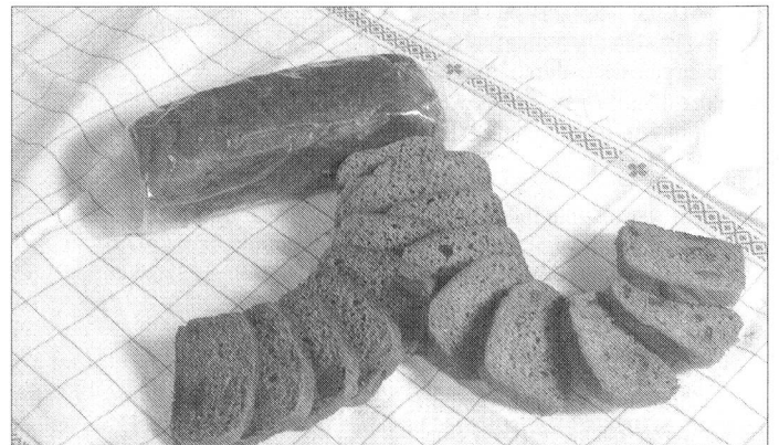
Besondere Schweizer Armee-Geschichte schrieben das Original-«Frischhaltebrot» (oben) und das «Früchtbrot» (unten im Bild).