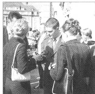
Dieses Bild sagt doch mehr als 1000 Worte.

Diese Feststellung machte auch der Finanzdirektor des Kantons Bern, Regierungsrat Urs Gasche. Eine solche Kaderschule sei eine der positiven Seiten des Militärdienstes. Vieles habe er dabei nun auch im zivilen Berufsleben umsetzen können. Auftragstreue sei entscheidend für den militärischen Erfolg, aber ebenso für sich persönlich und das Zivilleben.