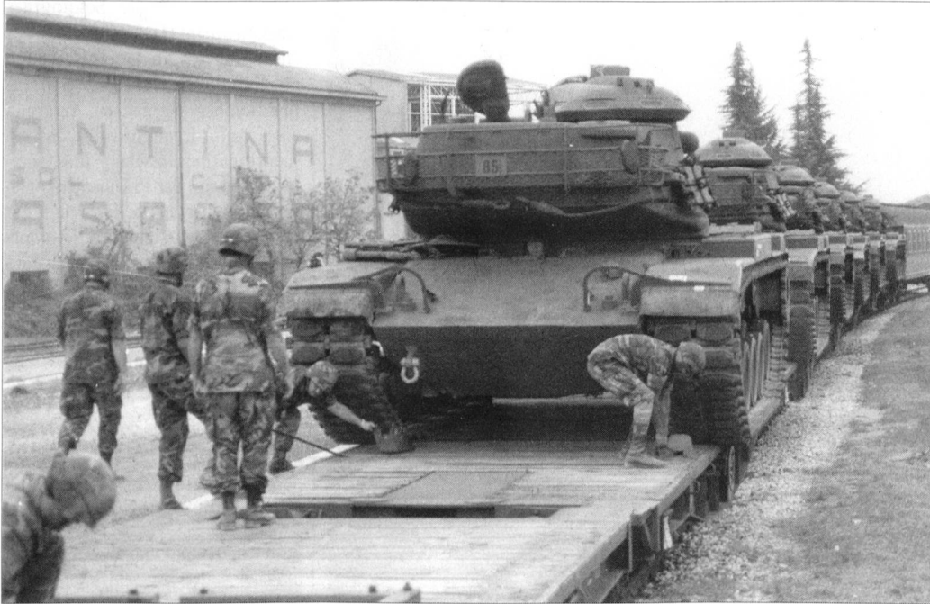
Bald werden die US-Panzer Europa verlassen. Das Bild stammt aus einem «Reforger-Manöver» der 80er-Jahre. Damals wurde noch die Verlegung von US-Verstärkungen an die «Front» des Kalten Krieges geübt.

Sie kamen als Kriegsgegner, blieben ein Jahrzehnt als Besatzer und sicherten im Kalten Krieg Resteuropa vor dem Zugriff der kommunistischen Sowjets. Nach über einem halben Jahrhundert Anwesenheit in Europa werden nun fast die gesamten Kampftruppen abgezogen beziehungsweise neu formiert. Bereits während des Vietnamkrieges und nach dem Zusammenbruch der Sowjetunion kam es zu umfangreichen Reduzierungen der früher über 300 000 Mann zählenden US-Streitkräfte. Innerhalb der nächsten zehn Jahre wollen die Amerikaner etwa 70 000 Soldaten sowie 100 000 Familienangehörige und Zivilangestellte aus Asien und Europa abziehen, davon den Löwenanteil aus Deutschland.