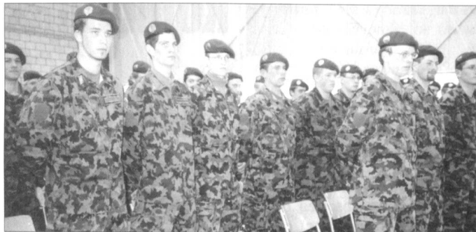
In der Halle O auf dem Waffenplatz Thun wurden neun Romands, ein Tessiner und 57 Deutschschweizer des Küchenchef-Lehrganges 3/05 zu Obergefreiten befördert.