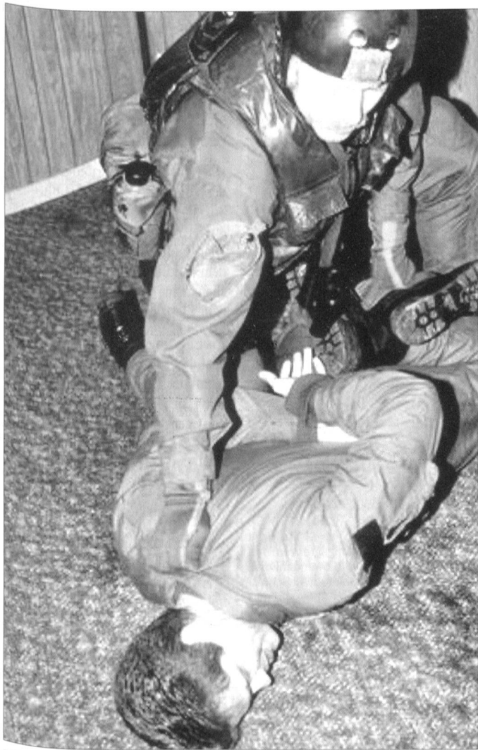
US-Nahkampfausbildung. Künftig steht wieder Kampf Mann gegen Mann im Mittelpunkt.

In zehn Jahren soll die Neugruppierung beendet sein. Anzunehmen ist aber, dass die Masse der Truppen bereits in den nächsten Jahren Europa verlassen wird und die US-Präsenz in Europa deutlich zurückgeht.