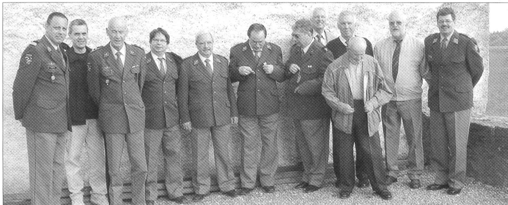
Allgegenwärtig: Zufriedene Gesichter. Stellvertretend für alle Teilnehmer der 88. Delegiertenversammlung des Schweizerischen Fournierverbandes (SFV) präsentierten sich auch die Vertreter der welschen Schweiz dem Fotografen.