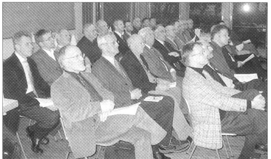
Aufmerksame Mitglieder anlässlich der Mitgliederversammlung.