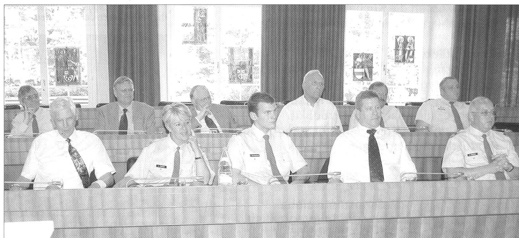
Der geschäftliche Teil konnte in Kürze unter Dach und Fach gebracht werden.

Gut gelaunt legten auch die fünf Sektionspräsidenten Rechenschaft über