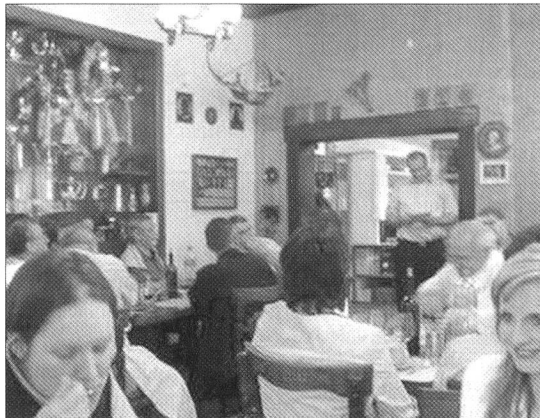
An einem richtigen Schiessanlass darf natürlich auch das gesellige Beisammensein nicht zu kurz kommen.