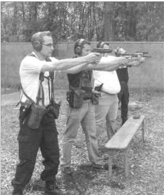
Mit voller Konzentration zu guten Schiessresultaten.