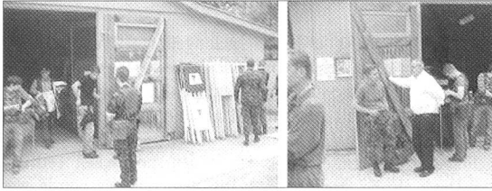
Die Teilnehmer fanden ideale Bedingungen vor.