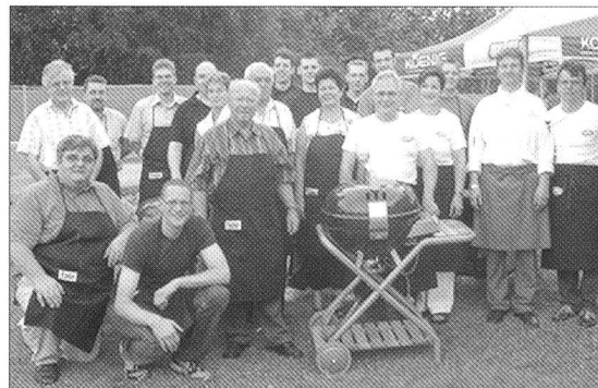
... und zu guter Letzt noch das obligate Gruppenbild.

Nach dem Frühstück führt uns die letzte Etappe wiederum mit der von Poschiavo über den Bernina-Pass nach Pontresina. Dort erwarten uns die Fahrer des AMMV, welche uns über den letzten Pass, dem Julier, zum Marmoreraese fahren. Gestärkt nach dem Mittagessen verlassen wir langsam den Gastkanton Graubünden und fahren zurück nach Aarau.