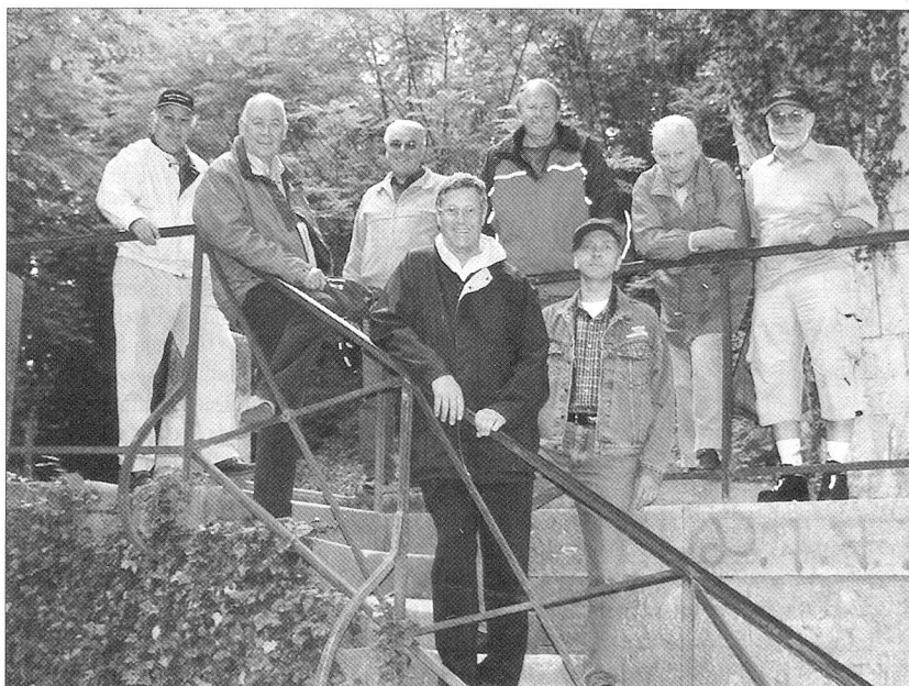
Pause sous le pont de l'Allondon, ancien pont du PLM.