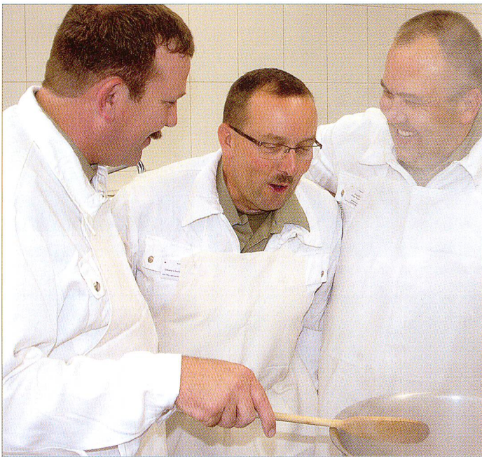
Ende gut – alles gut. Sogar Generäle können sich ob einer gelungenen Kochkunst so richtig erfreuen.