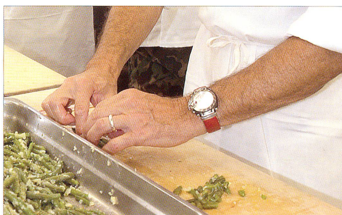
Nicht ungeschickt, die Hände von zwei Generälen unserer Armee beim Zubereiten von Speisen.