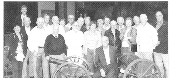
Les «canonniers et canonniers» devant le stand de tir.