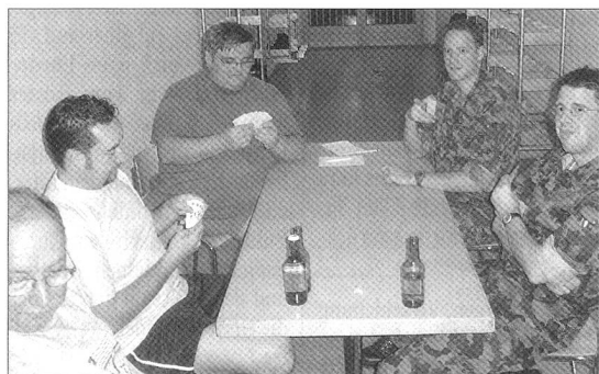
Immer wieder genügend Zeit fanden einige Unentwegte für einen gemütlichen Jass.

Es war auf jeden Fall amüsant. Der Sonntag war dann etwas gemütlicher, da wurde ich nur noch fünf Mal auseinander genommen, ein- und umgeladen.