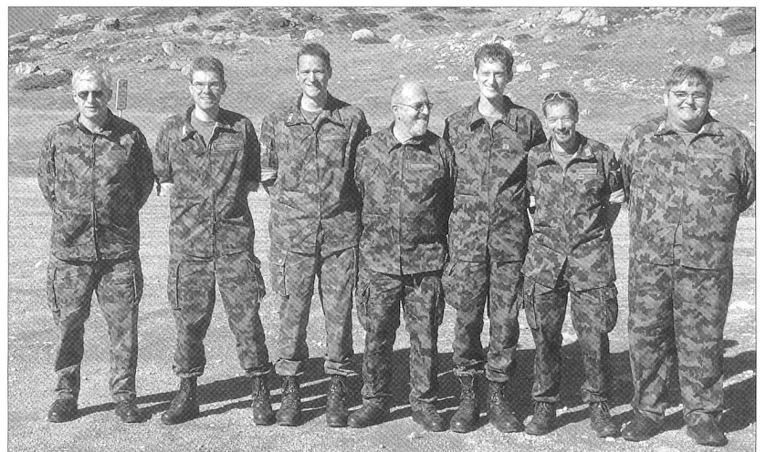
Diese Teilnehmer waren an allen fünf Übungen mit dabei.