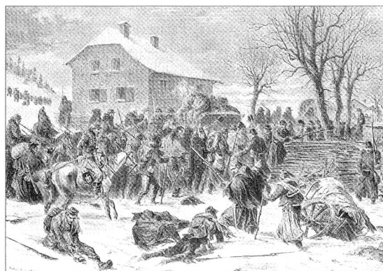
Originalkomposition von G. Roux. Entwaffung der Bourbaki-Armee in Les Verrières (Februar 1871).