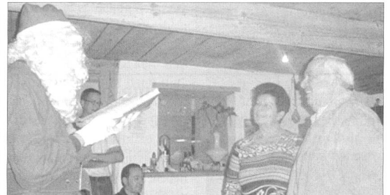
Nicht nur Kinder, auch Erwachsene können Freude zeigen beim Besuch des Samichlause.