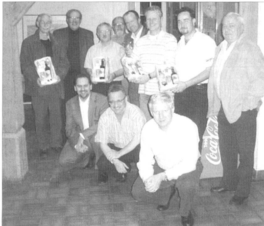
Wenn man dieses Siegerbild anschaut, scheint sich es doch zu bewahrheiten, dass die Rüebliländler viele und gute Jasser haben.