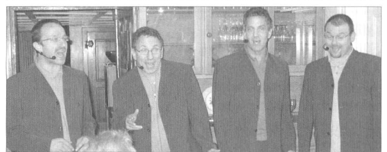
Das Gesangs-Quartett «four for you» erfreute die Anwesenden mit drei Gesangsblöcken.

Gesprächsstoff gab es genügend beim anschliessenden Imbiss, der durch die Sektion offeriert wurde, im nahe gelegenen Restaurant Fass.