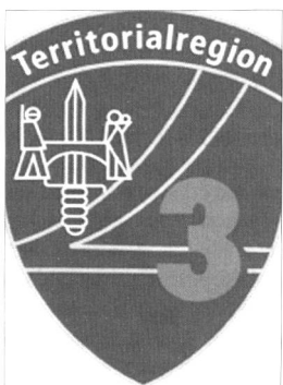
nen, in der Gegenwart handeln, die Zukunft vorbereiten.» Unter diesem Leitmotiv

PEFFAIKON SZ, 12. Januar – «Von der Vergangenheit ler-