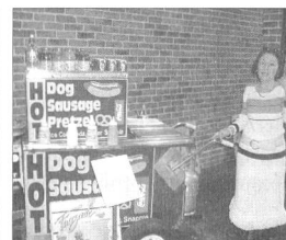
Notre sympathique guide nous présente le pushcart.