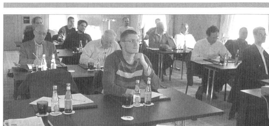
Les membres de l'ARFS et de la SSOLOG de retour sur les bancs de classe.

La journée s'est poursuivie par la visite du Musée de l'alimentation de Vevey, une fondation Nestlé créée en 1980, qui propose une découverte passionnante des multiples aspects de l'alimentation, de manière vivante et dynamique. Ce musée est composé de 4 secteurs ayant pour titre un verbe alimentaire: CUISINER, MANGER, ACHETER et DIGERER, ainsi que d'un ESPACE NESTLÉ, unique salle historique du bâtiment, construit immédiatement après la Première Guerre mondiale pour être le premier siège administratif de Nestlé. En passant d'un thème à un autre, notre charmante guide nous a fait découvrir les différentes habitudes alimentaires, l'évolution des ustensiles de table, les différentes transformations qui rendent les aliments consommables et per-