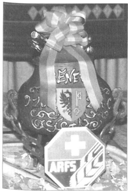
La marmite garnie de 3,0085 kg.

Notre président salua en particulier un ancien qu'on n'avait