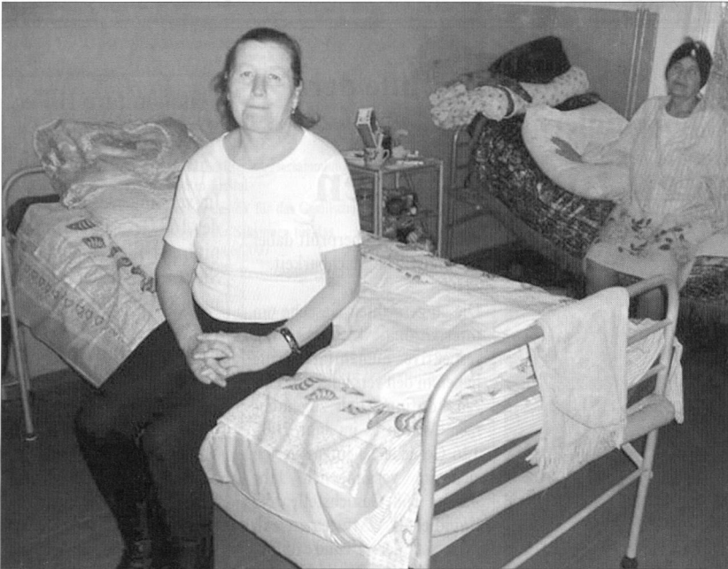
2005 wurden für ein DEZA-Projekt Betten und Matratzen für Spitäler in Moldawien geliefert.

Humanitäre Hilfe (SKH) in der DEZA: «Die Zusammenarbeit zwischen dem VBS beziehungsweise der Armee und der DEZA, insbesondere die humanitäre Hilfe, haben bereits Tradition. Mit dem Projekt «Weiterverwendung Armeematerial» haben wir gemeinsam einen weiteren Schritt gemacht. Überschüssig gewordenes Armeematerial wird durch die LBA zur Verfügung gestellt und in Programmen der DEZA eingesetzt. So können ganz gezielt echte Bedürfnisse abgedeckt und die Verwendung des Materials begleitet und überprüft werden.» Frisch weiter: «Die sehr gute Zusammenarbeit soll weiter vertieft und noch ausgebaut werden.»