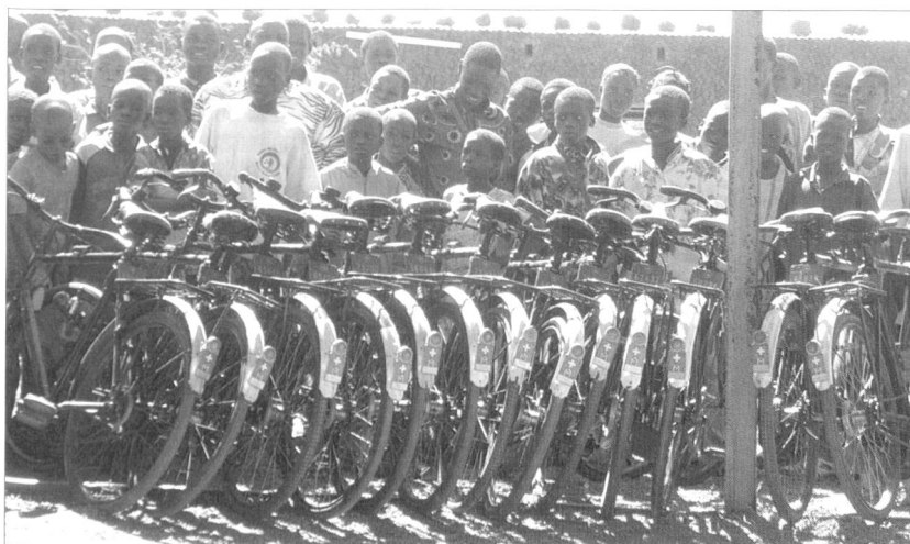
Fahrräder für Burkina Faso.