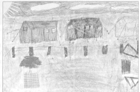
Das liquidierte Armeematerial wird in anderen Ländern sehr geschätzt.