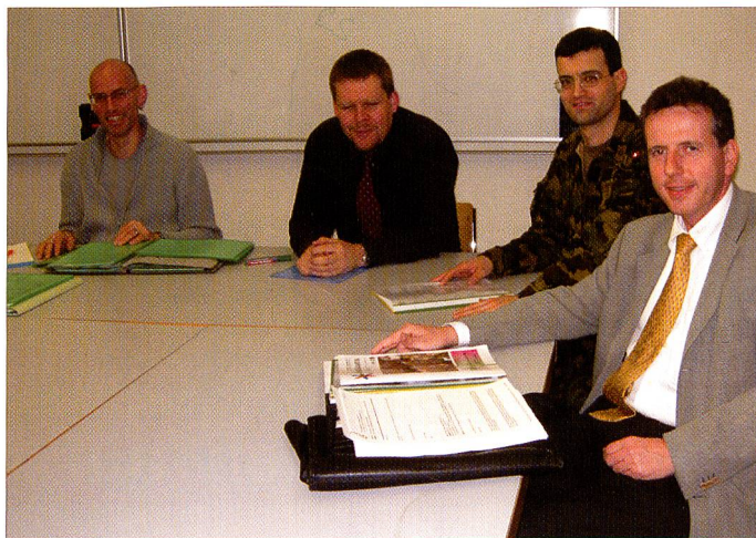
In Bern tagte der Zentralvorstand des Verbandes Schweizerischer Militärköchenchefs (VSMK) zur 14. erweiterten ZV-Sitzung (Bilder links). Ebenfalls der ZV des Schweizerischen Fourierverbandes bereitete in der Kaserne Aarau die kommende Delegiertenversammlung vor; jedoch im Gegensatz zum VSMK in einer eher trockenen Umgebung.