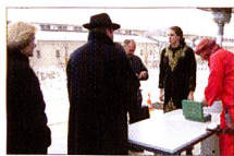
Einen grossen, vielschichtigen und bunten Interessentenkreis zogen während der Museumsnacht die verschiedenen Angebote rund um «1001 Nacht» der Eidgenössischen Militärbibliothek an, die in der Nacht vom 23. März ganz Bern verzauberte.