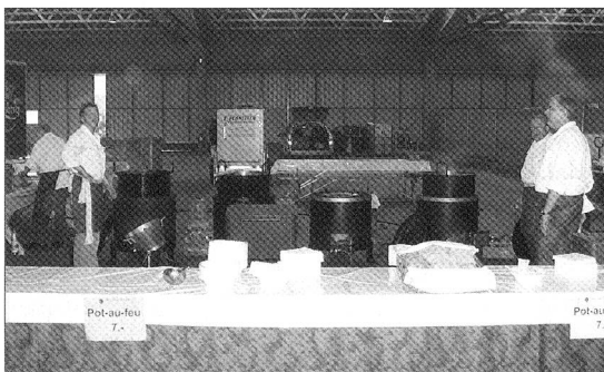
VSMK-Mitglieder Berner Oberland bei den Vorbereitungen für den Grossanlass Armeegant in Thun.