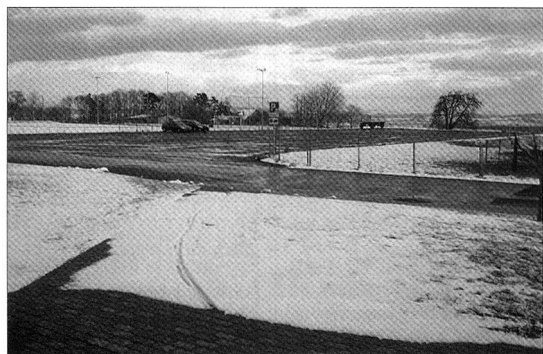
Die Besammlungs- und Parkplätze für Militärfahrzeuge sind durch die Gemeinden unentgeltlich zur Verfügung zu stellen.