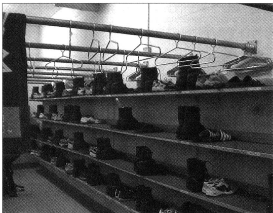
Beispiel für einen Kleidertrocknungs- und Schuhraum.

Weniger ist mehr, auch wenn es um Truppenunterkünfte der Schweizer Armee geht. Diese braucht in Zukunft weniger, dafür aber besser ausgerüstete gemeindeeigene Truppenunterkünfte. Das Departement für Verteidigung, Bevölkerungsschutz und Sport (VBS) hat deshalb für die Gemeinden eine Broschüre mit den neuen geforderten Standards an die gemeindeeigenen Truppenunterkünfte herausgegeben. Das Truppenrechnungswesen in der Logistikbasis der Armee (LBA) sorgt als vorgesetzte Stelle im Bereich des Kommissariatsdienstes dafür, dass die neuen Richtlinien und der Ablauf beim Bezug einer Truppenunterkunft in der Praxis entsprechend umgesetzt werden. Eine Wegleitung. Den ersten Teil finden Sie in der letzten Ausgabe (Mai/2007) von ARMEE-LOGISTIK ab Seite 13.