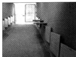
Mögliche Lösung eines Abgangs zu einer Zivilschutzanlage.