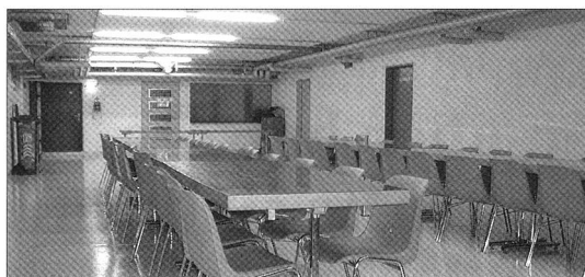
Beispiel eines Verpflegungsraumes