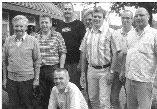
Auf dem Bild fehlen Walter Stucki und Peter Salathé, die etwas später zur Gruppe gestossen sind.

Zurück geblieben ist die enge Verknüpfung der damaligen Verantwortungsträger. Und so trifft man sich jährlich zum «ZV-Ausflug». Den Samstag 23. Juni organisiert hat der ehemalige Zentralpräsident Four Urs Bühlmann. Dabei gehts jeweils nicht nur um ein gemütliches Beisammensein. Getestet wird der heutige Wissensstand und die Fitness der leicht ergrauten Herren. Entschuldigen mussten sich zwei ZV-Mitglieder. Einer, der jeweils leider passen muss, ist