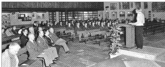
Ständerätin Erika Forster während ihres Gastreferates in der Kirche Heiligkreuz (SG).