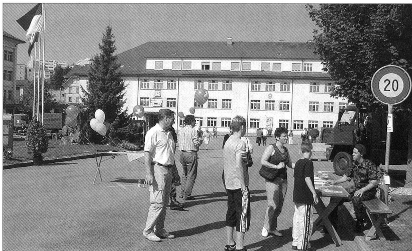
Im Zentrum vieler Leute an der 850-Jahre-Feier von Freiburg stand auch der Tag der offenen Tür der Nach- und Rückschub-Schule 45.

Entgegen bisherigen Hoffnungen ist nach wie vor nicht entschieden, ob das neue Soldatenmesser international ausgeschrieben werden muss oder nicht. Die armassuisse gibt lediglich an, dass die Ausschreibung «nicht unbedingt» international erfolgen muss. Die Schweiz habe jedoch das internationale Beschaffungsabkommen GPA unterzeichnet, an das man sich halten müsse.