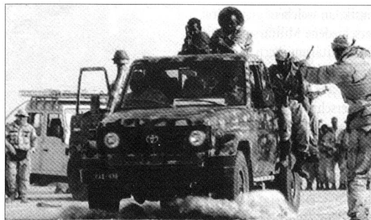
Ausbilder der 10th Special Forces Group trainiert Soldaten in Nordafrika.

intensivieren, sondern auch den Zugang zu den Rohstoffen absichern. Natürlich sind die noch unerschlossenen, gewaltigen Öl- und Gasvorkommen als Teil der Energieabsicherung politisch und wirtschaft-