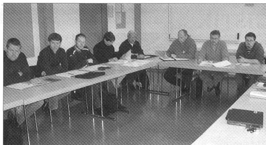
Zur ordentlichen Zentralvorstandssitzung trafen sich in der Kaserne die Mitglieder des SFV.