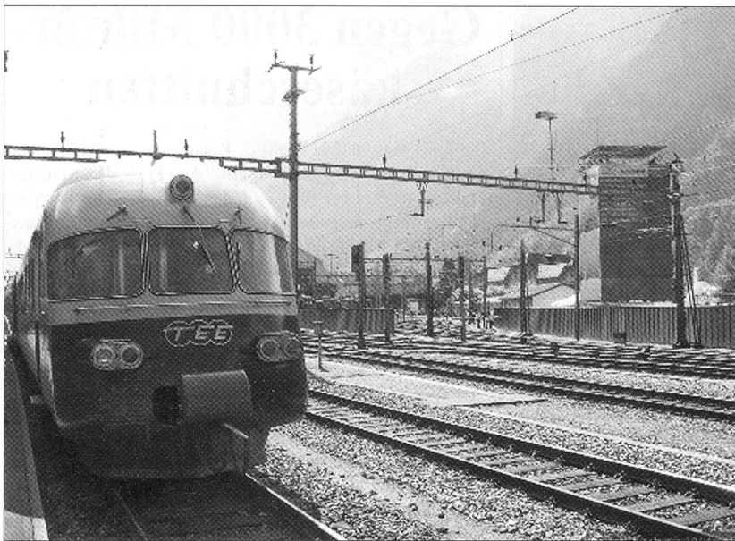
Erstfeld: Auch der legendäre RAe 1053 ist bereit zur Fahrt über den Berg.