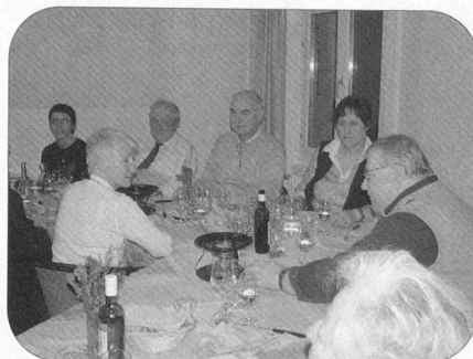
Tout est prêt!