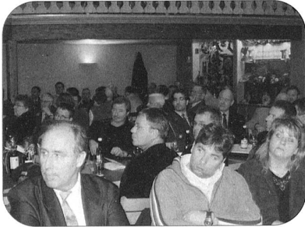
Soweit das Auge reicht: Mit grossem Interesse verfolgten die über 100 Personen den geschäftlichen Teil.