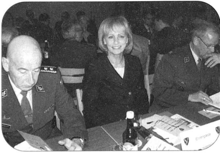
«Nicht so ernst, meine Herren!»