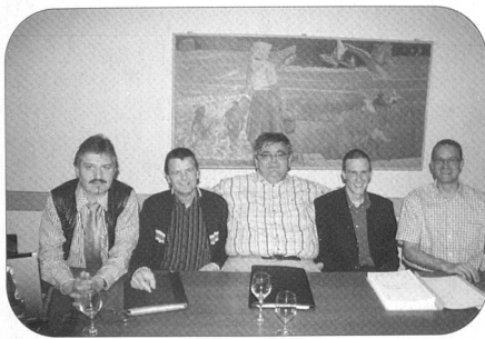
Unser Bild zeigt den Vorstand.