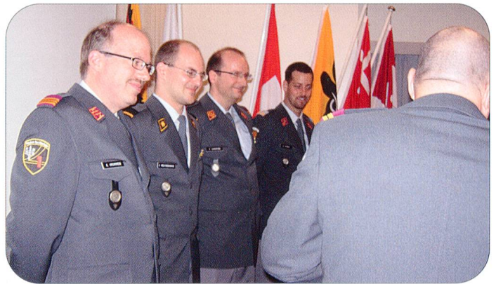
Auch den vier Sektionspräsidenten wurde für die grosse Arbeit während des ganzen Jahres ein Präsent überreicht.