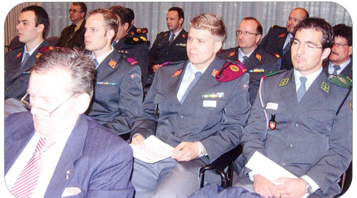
Die 12. Mitgliederversammlung der SOLOG ging reibungslos über die Bühne und voller Zuversicht sieht man der Kommenden entgegen.