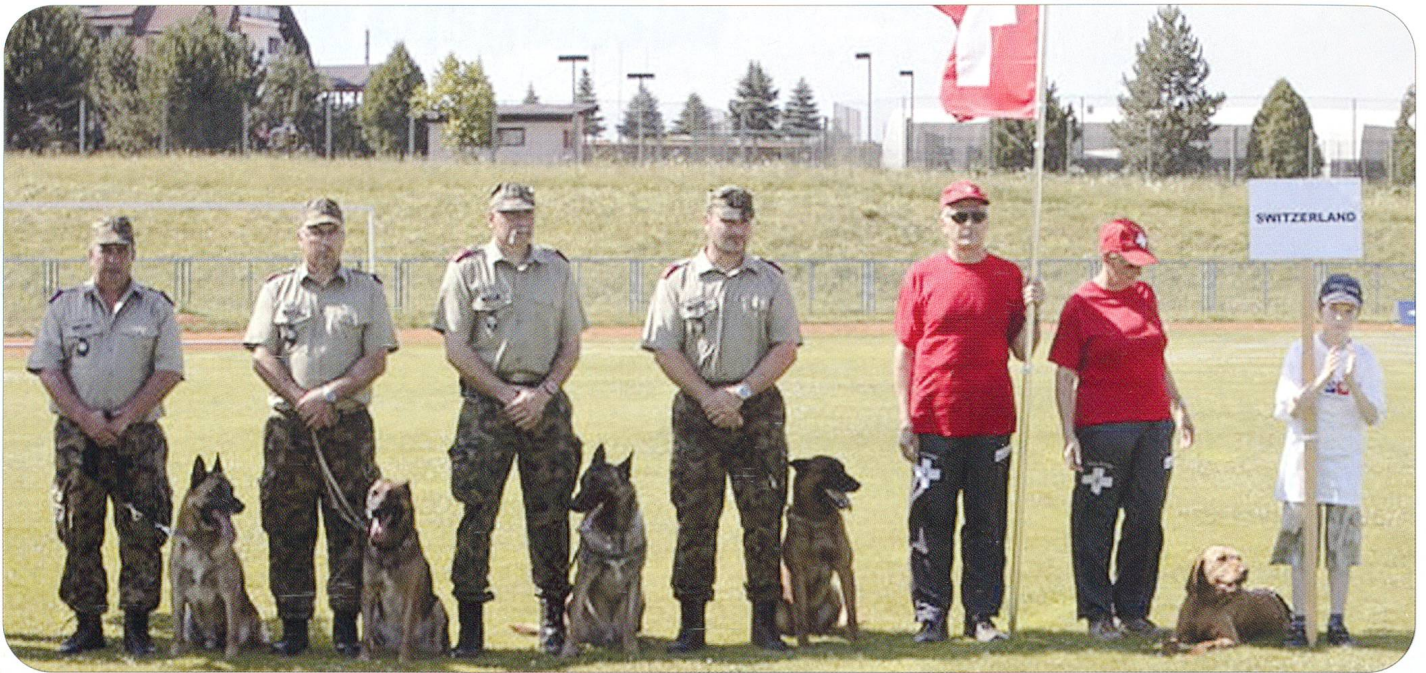
Im kroatischen Samobor kämpfte diese Schweizer Delegation um den Weltmeistertitel.