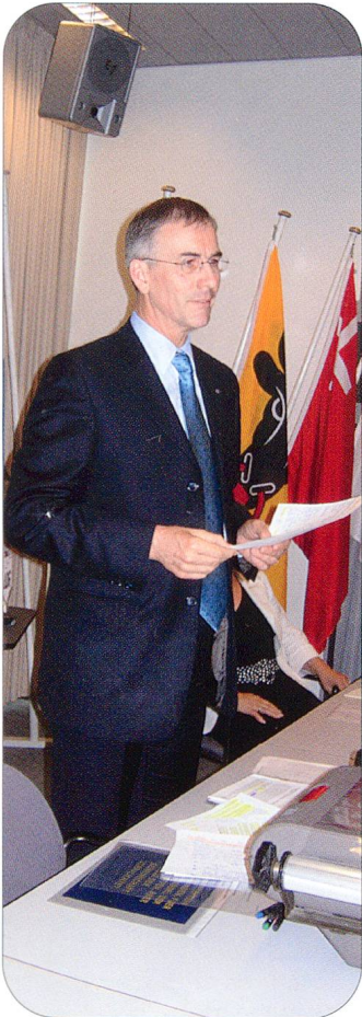
Nationalrat Pius Segmüller.