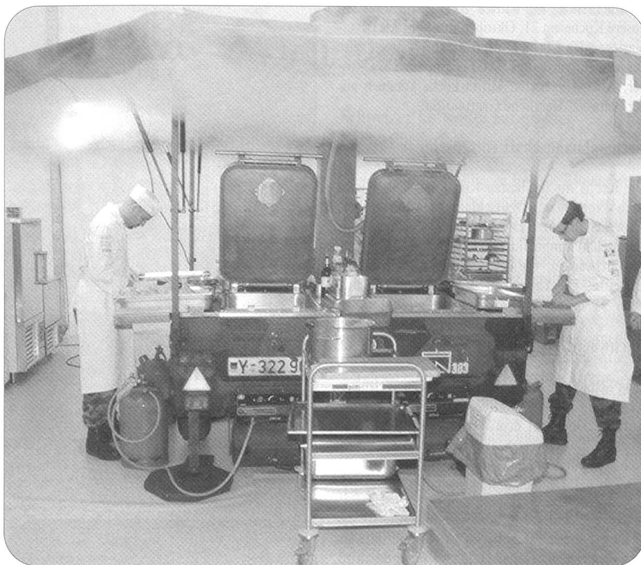
Zweimal mussten die Militärköche «unter Feldbedingungen» an den Herd. Zunächst war ein Drei-Gang-Menü für 150 Personen auf einer Feldküche der Nato zu zubereiten.