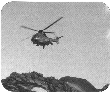
Super Puma auf dem Anflug auf die Ebenfluh (Axalp).

Der rasante globale Bevölkerungszuwachs vergrössert die Reibungsflächen. Bewaffnete Konflikte, Katastrophen, Unruhen und militärische Aggressionen führen zu Krisen, Migrationen, Terrorismus und Krieg. Sie sind ernst zu nehmende Bedrohungen und Gefahren, auch für die Schweiz. Die Luftwaffe übernimmt einen wichtigen Teil deren Erkennung und Bekämpfung: Sie sichert die Lufthoheit, leistet Katastrophenhilfe, überwacht den zivilen Luftraum (circa 3000 Flugbewegungen im Tag), hilft bei Navigations- und Funkproblemen, erfasst und überprüft unangemeldete Überflüge.