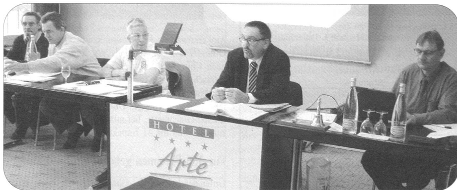
Gut vorbereitet und speditiv wickelte der Zentralvorstand die Geschäfte ab.