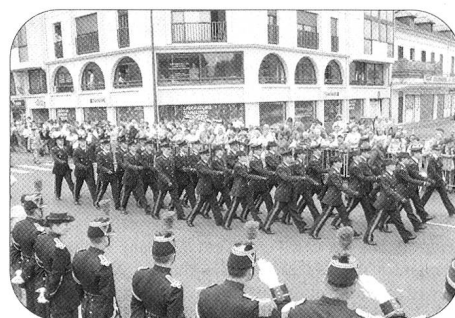
Un détachement de l'armée italienne.