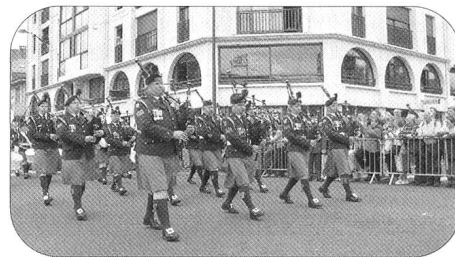
Irlande – les cornemuses.