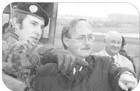
Ab Neujahr bestimmt ein neuer Verteidigungsminister die Marschrichtung der Armee – oder auch nicht!