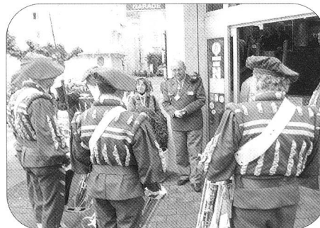
Aubade donnée en l'honneur de notre aumônier décoré par la section des hallebardiers du Haut-Valais.