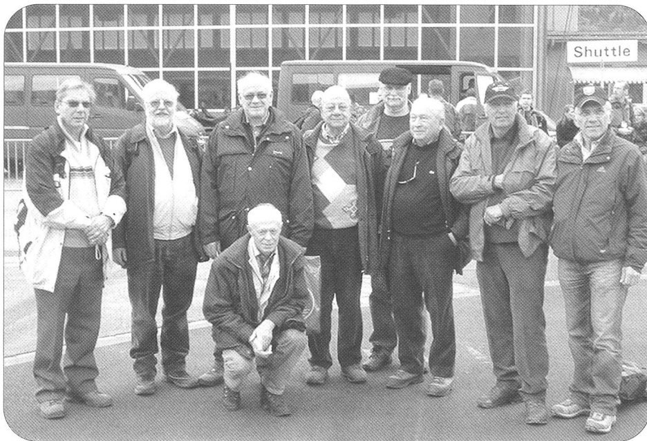
Participants de l'ARFS à l'exercice de l'Axalp.