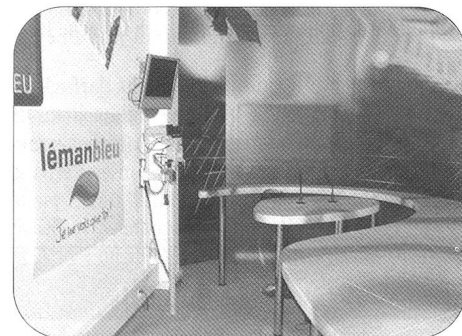
Plateau du «Journal TV».

Une quinzaine de membres du groupement genevois de l'ARFS se sont retrouvés devant les locaux de la