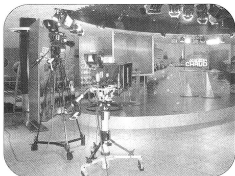
Plateau prêt pour l'émission «Genève à chaud».