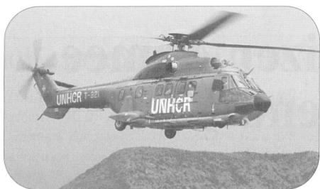
Die Luftwaffe setzte in Albanien drei Super Puma ein, die eine UNHCR-Beschriftung erhielten.

ihren Auftrag erfüllt; sie zieht sich in die Schweiz zurück. Am 21. März 1990 wird Namibia unabhängig. Der Einsatz in Namibia ist der erste einer ganzen Schweizer Einheit in einer UNO Mission.