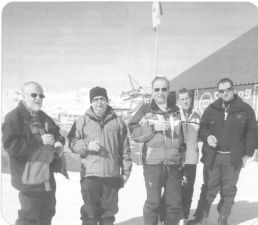
Le gpt valaisan goûte les plaisirs de la neige et... d'un crû du canton.