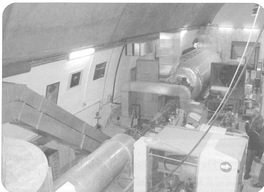
Installations du CMEFE.