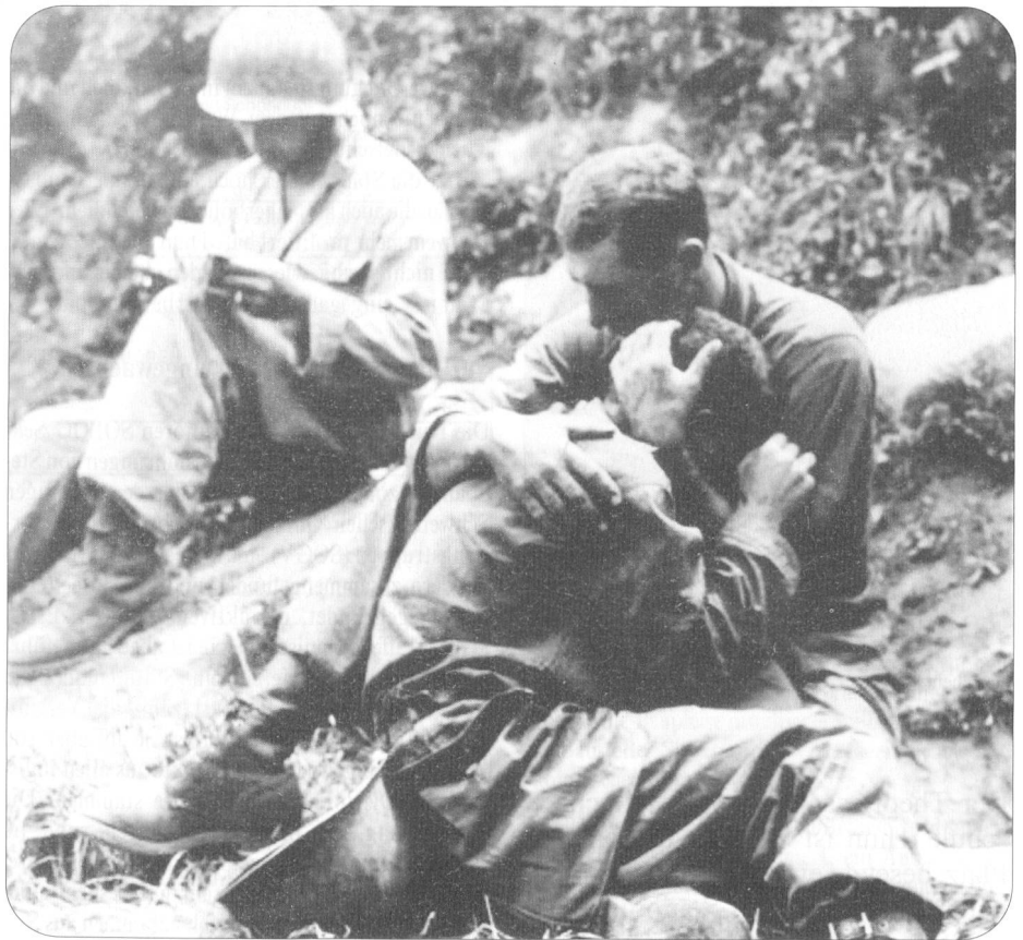
Soldaten stehen im Einsatz unter schweren seelischem Druck. Ein GI sucht Trost bei einem Kameraden (Koreakrieg).