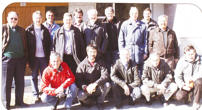
POSCHIAVO. – Ein Gruppenbild mit den Teilnehmern der 70. Generalversammlung der Bündner.

In die Geheimnisse eines ausgeklügelten und bestens funktionierenden Managements liessen sich Mitglieder der Sektion Zentralschweiz der SOLOG einweihen.