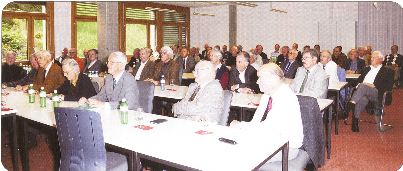
THUN. – Der Theoriesaal in der Hotelfachschule Thun ist bis zum letzten Platz besetzt, eine Rekordbeteiligung, als die aktiven Senioren der Schweizerischen Offiziergesellschaft der Logistik, Sektion Mittelland, am 30. April ihren ersten Anlass in diesem Jahr beginnen.