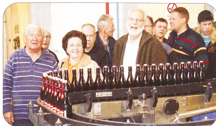
GOSSAU. – Fouriere und Küchenchefs staunten über die Details der einwandfrei funktionierenden Logistik einer selbständigen kleineren Brauerei. Übrigens gehört die Brauerei Stadtbühl in Gossau (unser Bild) zu den ältesten Industriebetrieben im Kanton St. Gallen.