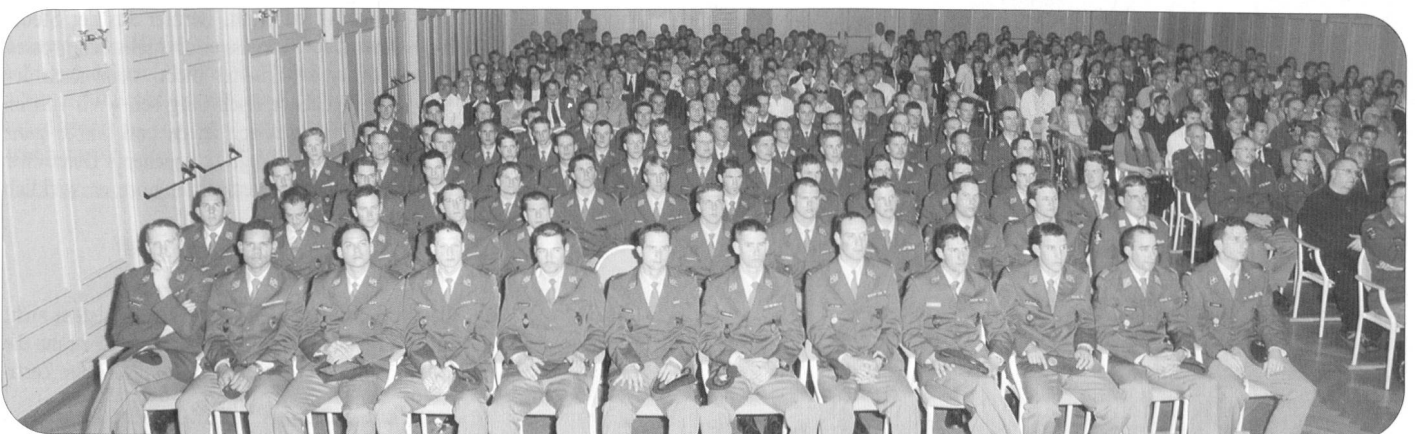
Am 29. Mai wurden im Casino Bern 73 Anwärter zu Logistik-Offizieren befördert.