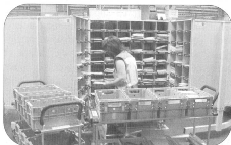
Chaîne de tri automatique du courrier arrivant